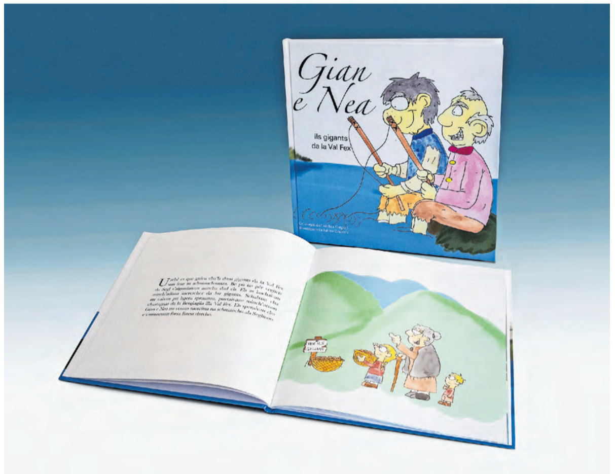
«Gian e Nea», ein romanisches Kinderbuch mit deutscher Übersetzung, handelt von zwei Riesen, die vor hundert Jahren im Engadin gelebt haben.

«Gian e Nea», Gammeter Media Verlag, ISBN 978-3-9525338-4-0. Das Buch kann im Buchhandel erworben werden oder über: www.gammetermedia.ch/crossmedia/buecher/